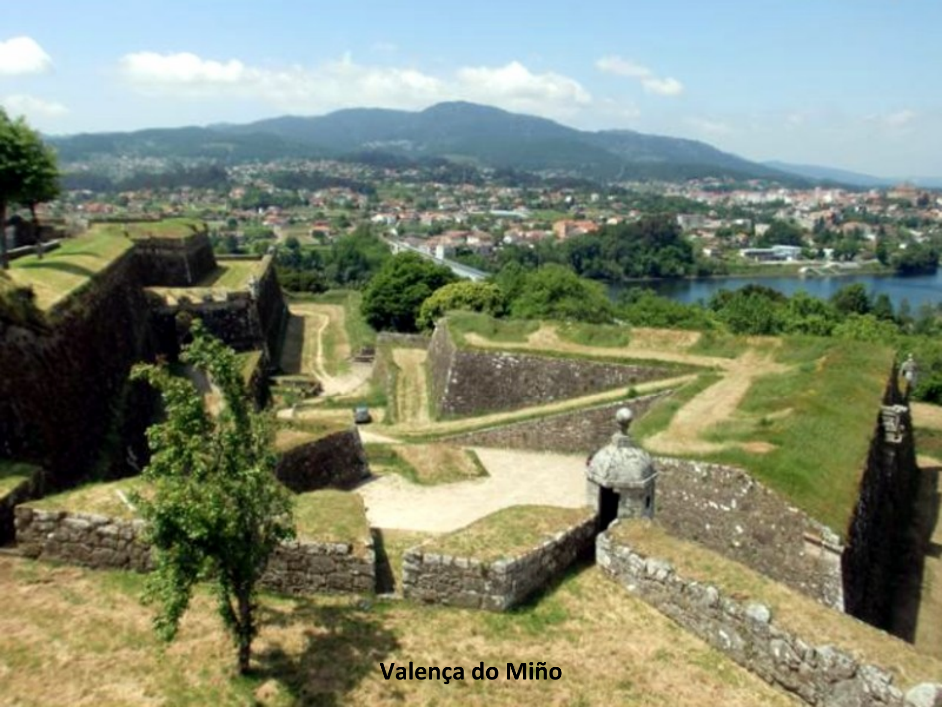
Valença do Miño