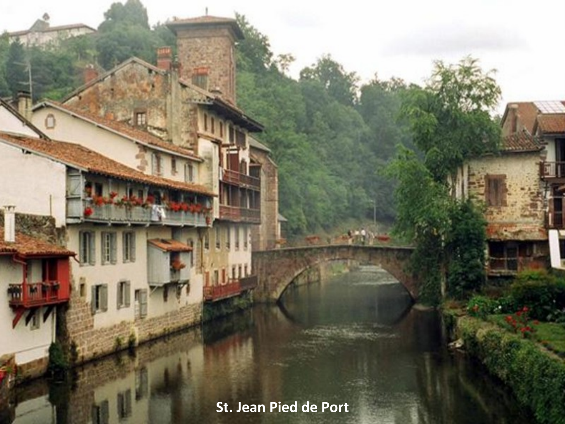
St. Jean Pied de Port