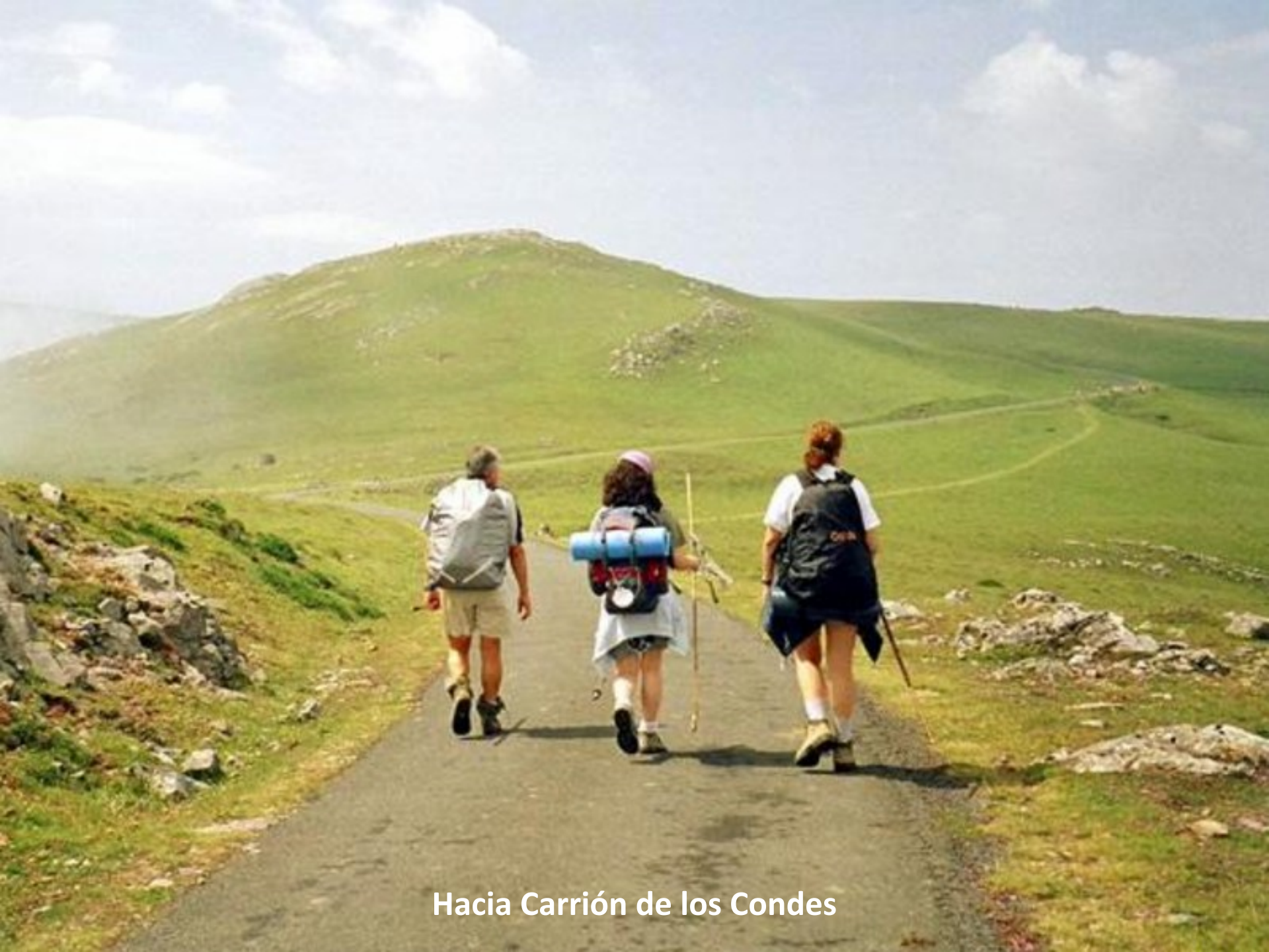
Hacia Carrión de los Condes