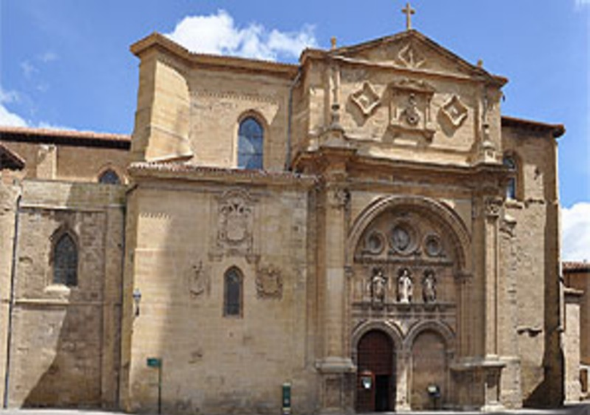
Sto. Domingo de la Calzada