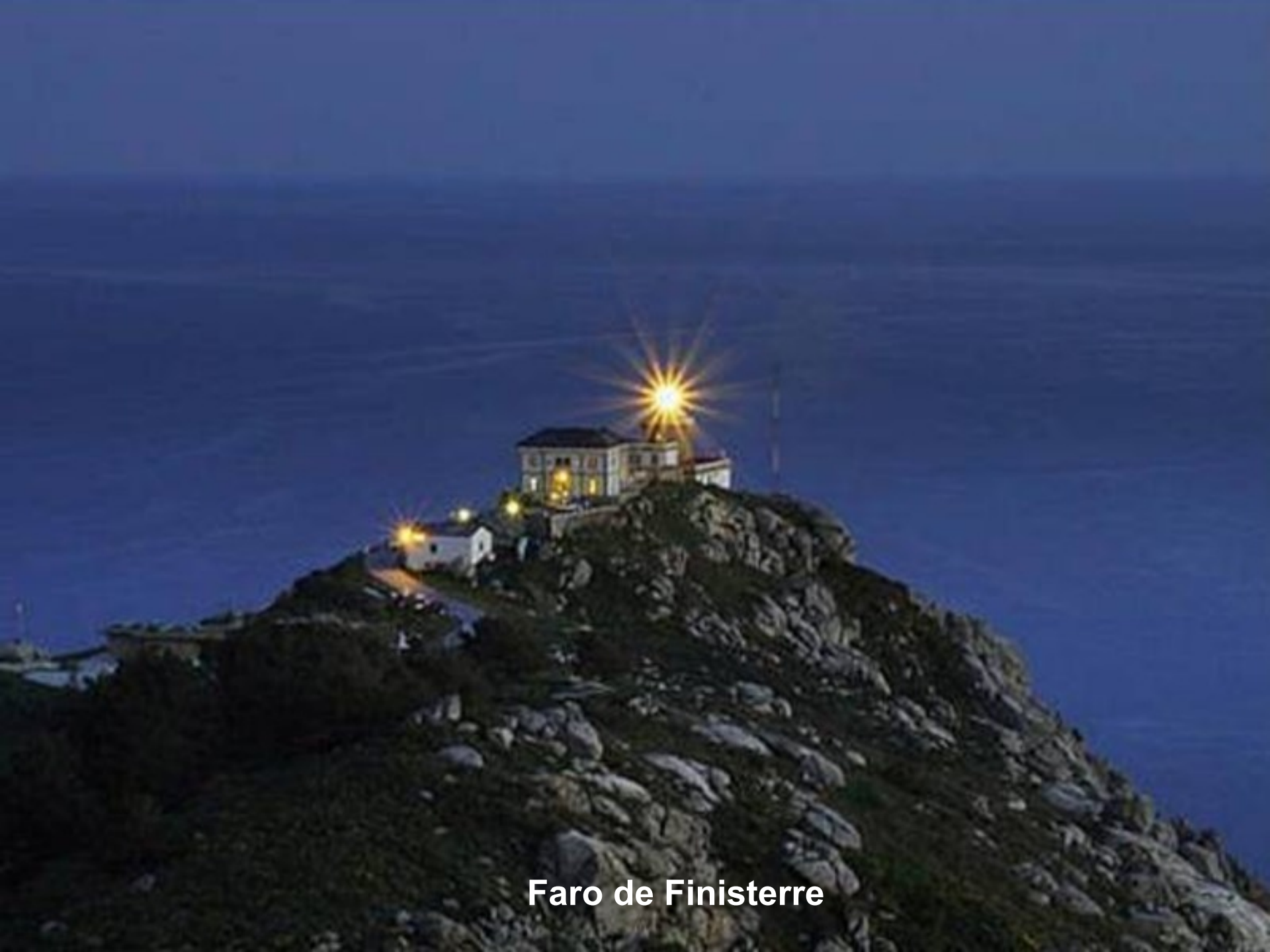
Faro de Finisterre