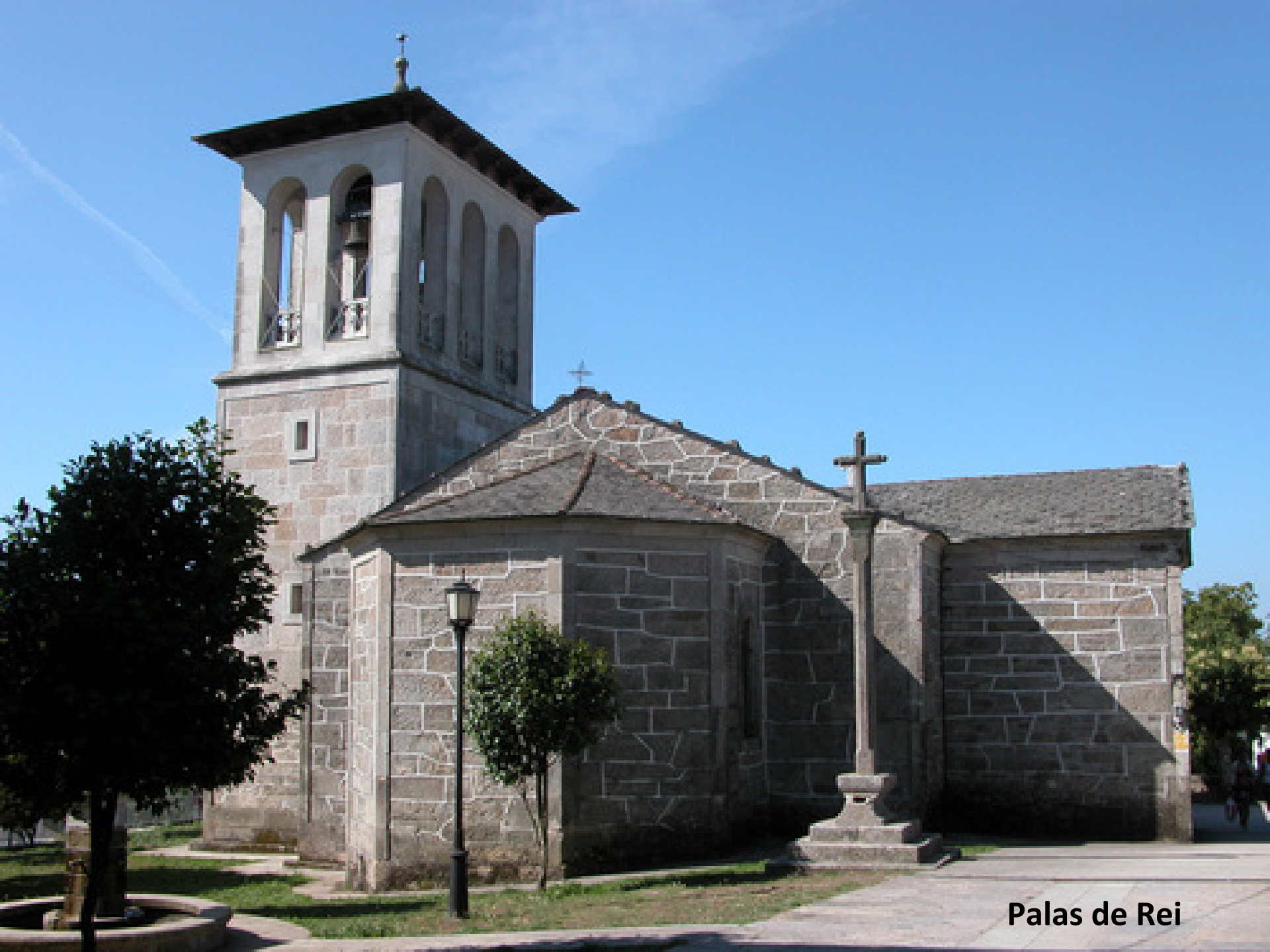
Palas de Rei