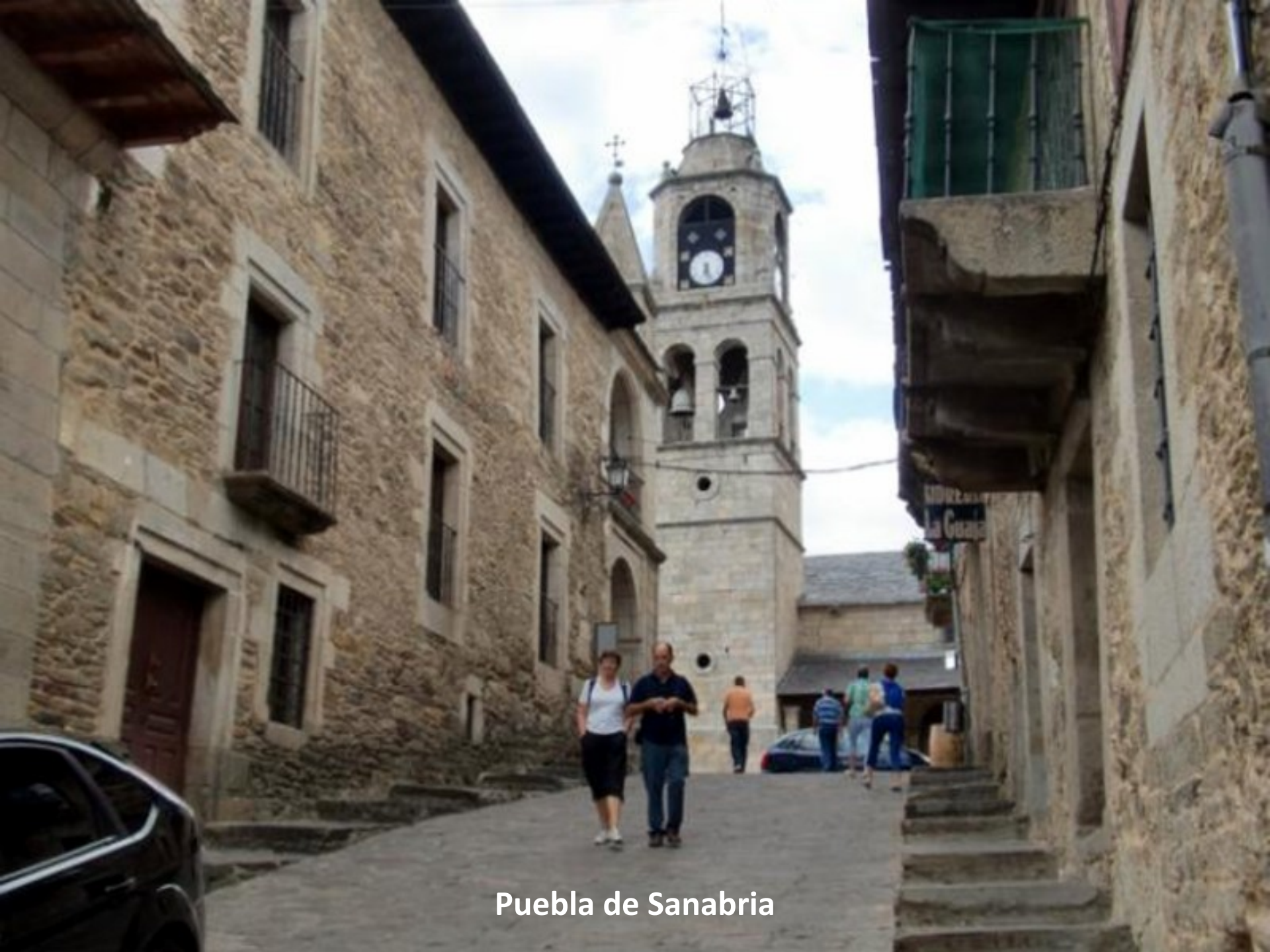
Puebla de Sanabria