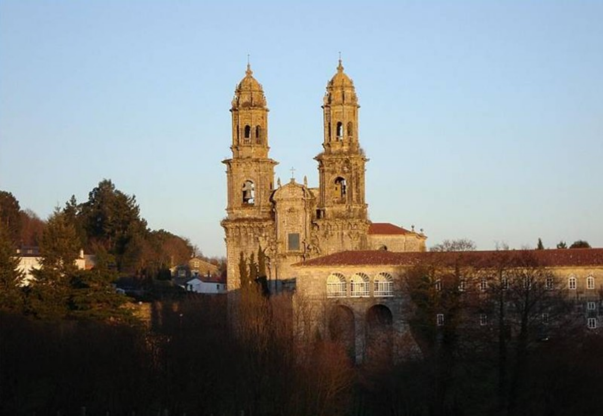
Sobrado de los Monjes